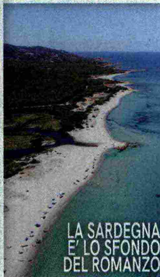
LA SARDEGNA E' LO SFONDO DEL ROMANZO

COME IN UN FILM Il libro "Un altro ballo ancora" degli Scrittori Pigri racconta di un amore tra due 80enni in un campeggio della Sardegna (sopra, a ds., il mare che fa anche da sfondo al romanzo). Un sentimento, l'amore senile, che si vive anche nel film "Le nostre anime di notte" (2017) con Jane Fonda, 85 anni, e Robert Redford, 86 (insieme, sopra). Sopra, a sin., "Elsa & Fred" (2014) con Shirley MacLaine, 89, e Christopher Plummer (1929-2021). Più sopra, a ds., "Appuntamento al parco" (2017) con Diane Keaton, 77, e Brendan Gleeson, 68.