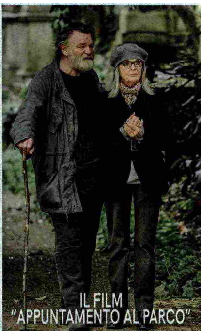
IL FILM "APPUNTAMENTO AL PARCO"