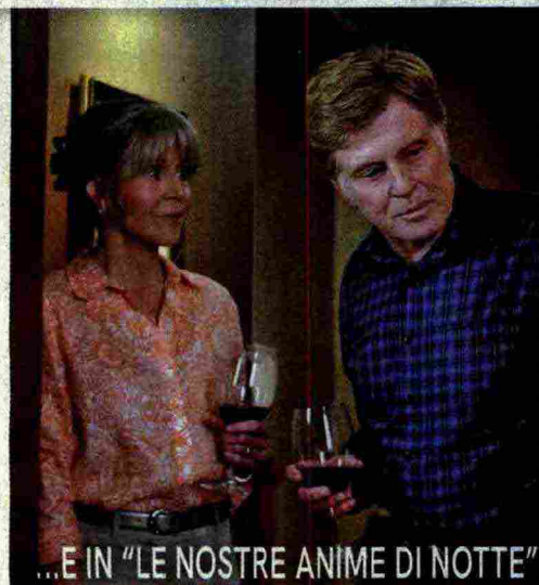
...E IN "LE NOSTRE ANIME DI NOTTE"